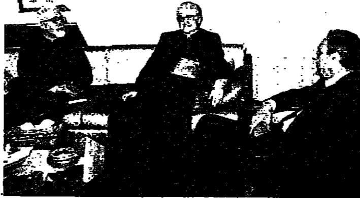
بزي مع بوانتي وابي نادر